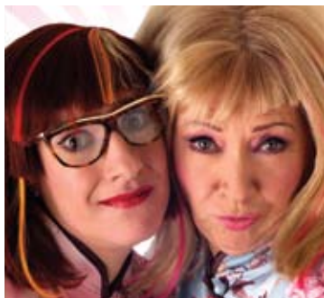
CAPA Cartaz “VIP MANICURE”