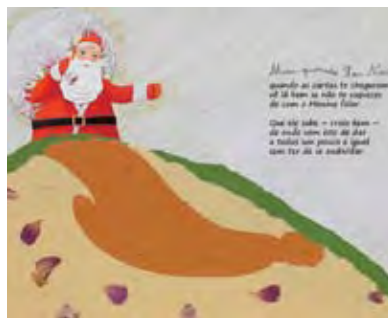
Ilustração de Gabriela Sotto Mayor Livro: O Pai Natal e o maiúsculo Menino Editora: Trinta por uma linha

Exposição de originais da ilustradora Gabriela Sotto Mayor. As ilustrações estão incluídas nos vários livros ilustrados pela autora, todos publicados pela Editora “Trinta Por Uma Linha”.