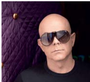
CAPA PEDRO ABRUNHOSA